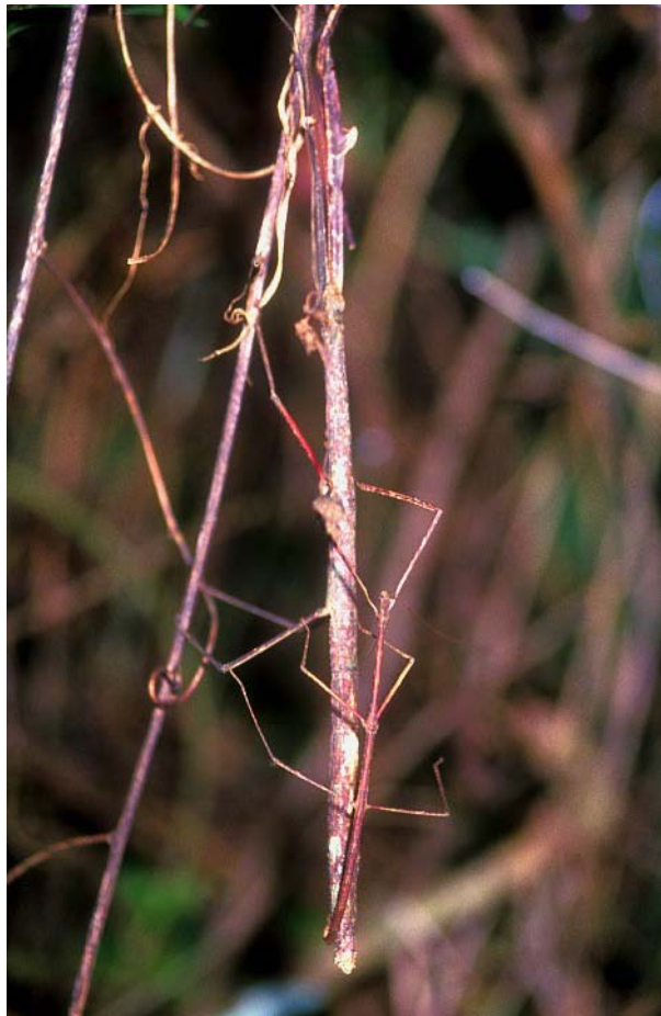
FIG. 7 – Accouplement de phasmes (Malaisie) : flash surélevé

Pour vraiment faire de la macro, on peut se contenter de matériel qui permet d'aborder le sujet, mais les règles de base que nous vous avons indiquées, et surtout les modes de raisonnement pour comprendre les résultats et prendre les décisions en amont vous ont montré déjà que ce n'est pas si simple.