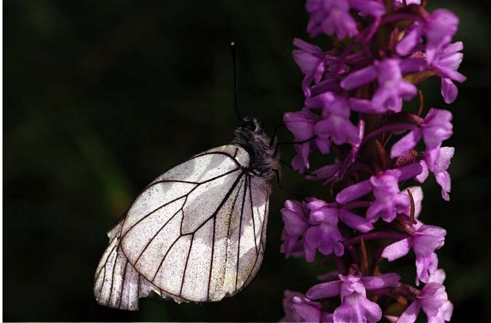
FIG. 5 – Papillon sur Orchis (Alpes) : Chasse devant soi. Notez que le coup de flash permet d'améliorer la profondeur de champ pour le papillon, mais pas toute la fleur (ouverture 11). Le coup de flash se note par le fond sombre. On voit que l'éclairage naturel du soleil domine quand même (ombre portée de l'orchis sur le papillon)