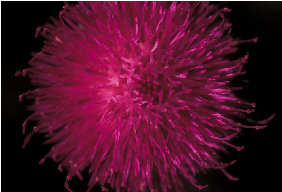
FIG. 3 – Scabieuse (Alpes) : Fond noir : en mode manuel, fermer l'ouverture, passer en vitesse rapide (donc sous exposition lumière naturelle), mettre le flash et laisser faire le ETTL.

La fleur est probablement la première chose que l'on photographie en macro.