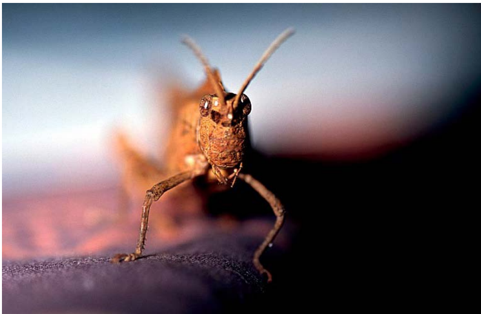
FIG. 11 – Criquet sur un tissu (Kenya) : ouverture 4, très faible profondeur de champ, éclairage latéral par une seule lampe torche.