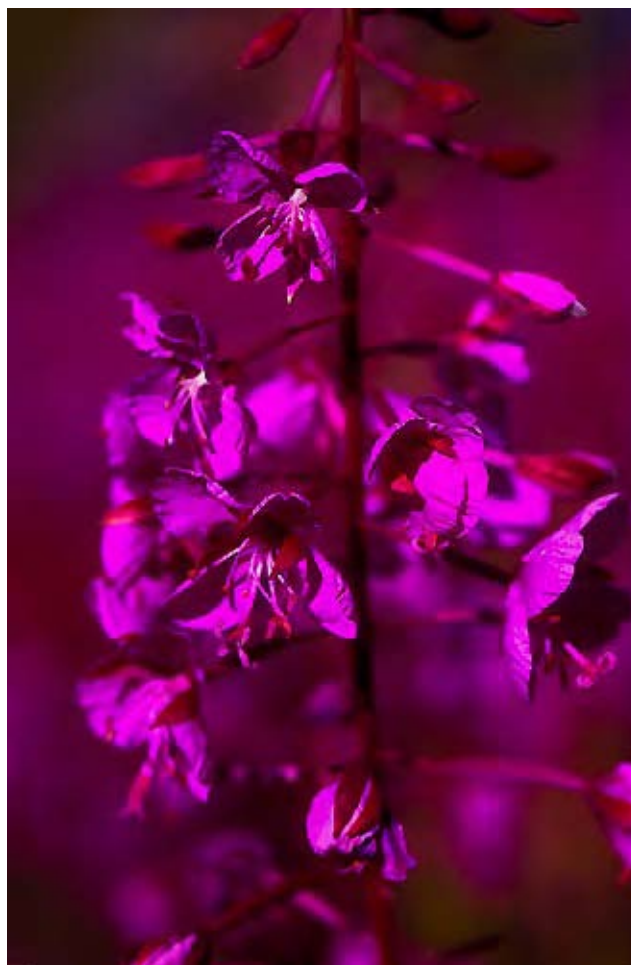
FIG. 4 – Epilobe (Alpes) : sur pied, sans flash (notez la couleur du fond dû au champ d'épilobes et visible par l'absence de flash). Si on veut détacher la fleur sur fond noir, il faut passer en manuel pour avoir une faible exposition par la lumière naturelle pour tout mettre sur le flash : voir Figure 4