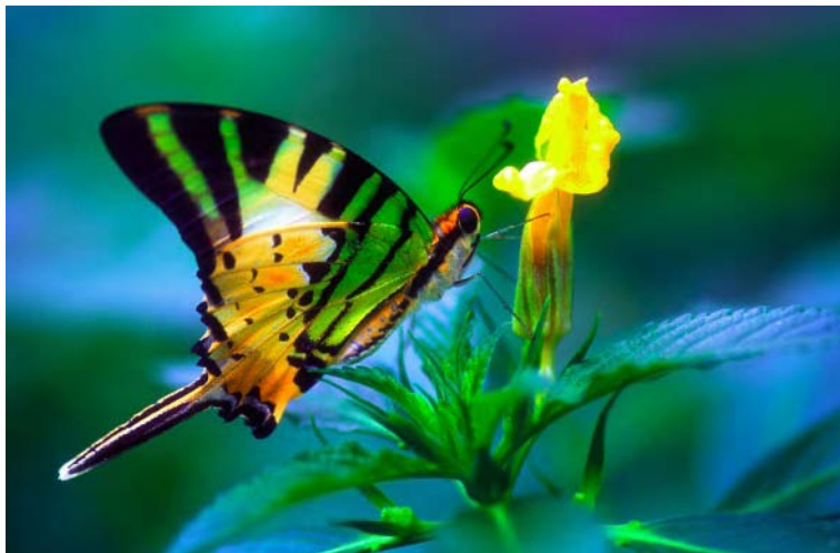
FIG. 1 – Papillon (Malaisie) : Faible profondeur de champ

L'effet peut être joli, mais sur un papillon par exemple, les ailes deviennent très rapidement floues si le plan des ailes n'est pas rigoureusement parallèle à celui du film. Et même, pour poursuivre l'exemple du papillon, si (comme l'indique la règle générale), on fait la mise au point sur l'oeil, les ailes seront floues.