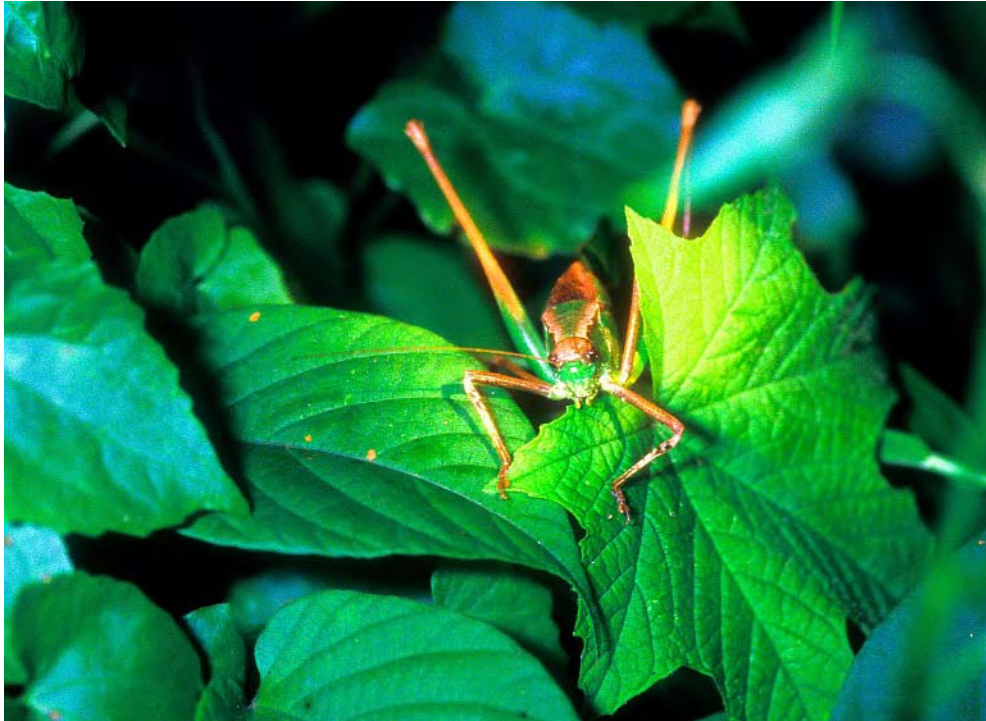
FIG. 10 – Sauterelle (Malaisie) : Flash : Metz MZ-45 focalisé manuellement au maximum.