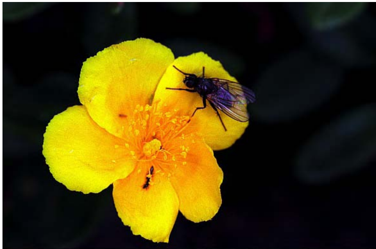
FIG. 2 – Mouche (Alpes) : sur pied à plat, avec flash (notez le fond très noir caractéristique du flash qui "efface" la lumière du jour)