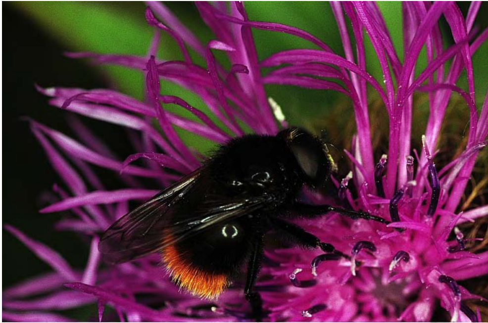
FIG. 9 – Bourdon sur centaurée (Alpes) : Notez la forme du flash visible par le reflet sur le haut de l'abdomen.