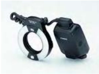
FIG. 8 – Flash annulaire Canon MR14EX