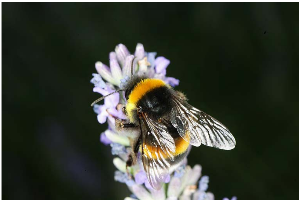
FIG. 6 – Bourdon sur fleur de lavande (Ile de France) : ouverture 16, flash, réglé pour profondeur de champ assez importante, de l'oeil aux ailes. Voyez comme la fleur devient floue.