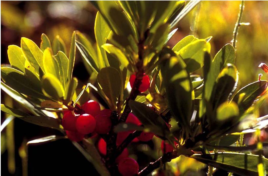
FIG. 12 – Raisin des ours en contre-jour (Tignes)